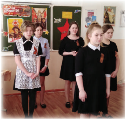
8 классы на конкурсе чтецов