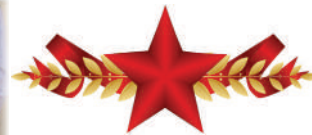
8 «Б» класс