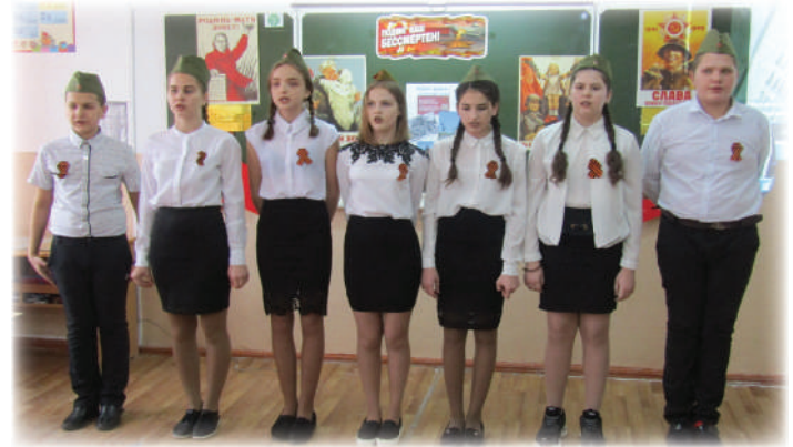
7 «Б» класс