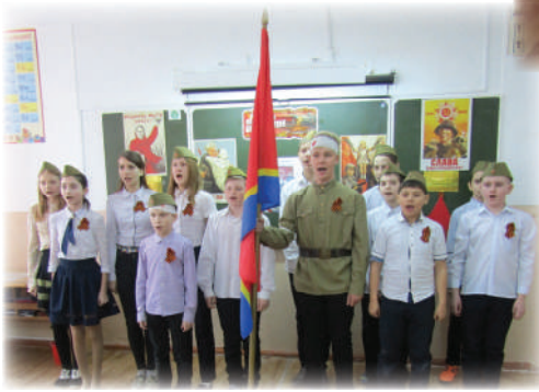
6 «В» класс