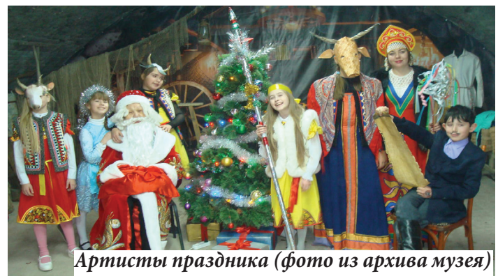
Артисты праздника

Светлоярский историко-краеведческий музей подготовил для юных светлоярцев мероприятие «Новогодние обряды». Учащиеся 5 «б» класса, которые посещают кружок на базе музея «Перекрёсток времён», приняли активное участие в данном празднике, показав свои организаторские и актёрские таланты. Гости, учащиеся начальных классов, участвовали в забавных конкурсах, в познавательных викторинах, узнали много интересных фактов, например, что с наступлением 1 января 1700 года отмечали праздник на Руси с установкой нарядного хвойного дерева. А ещё ребята повстречались с Дедушкой Морозом, который порадовал школьников сладкими призами.