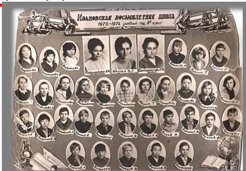
Это повзрослевшие первоклашки – выпускники 1974 года. На фото уже объединённый класс «а» и «б»